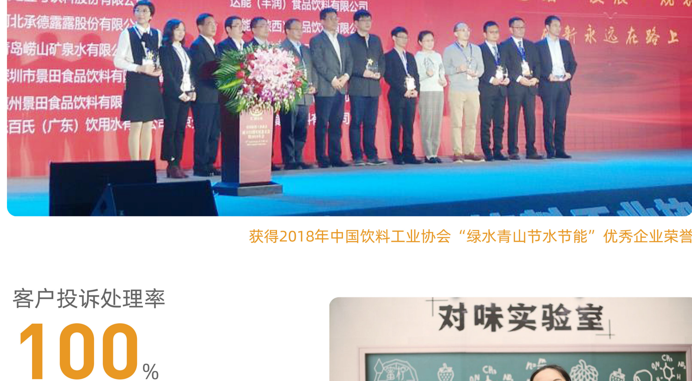
获得2018年中国饮料工业协会“绿水青山节水节能”优秀企业荣誉