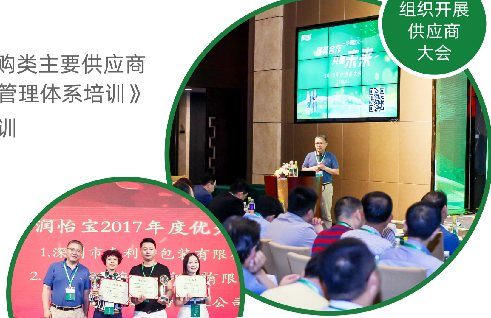
组织开展供应商大会