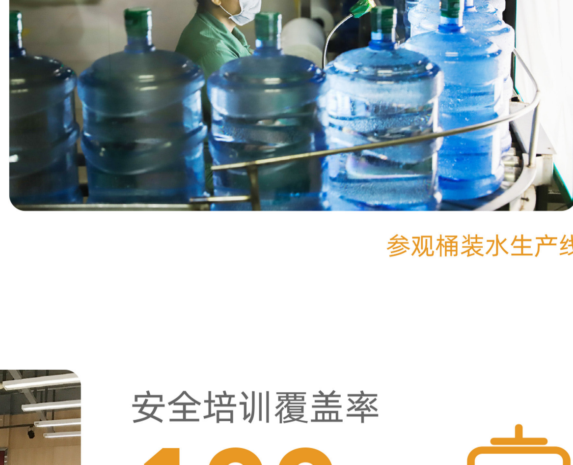
参观桶装水生产线