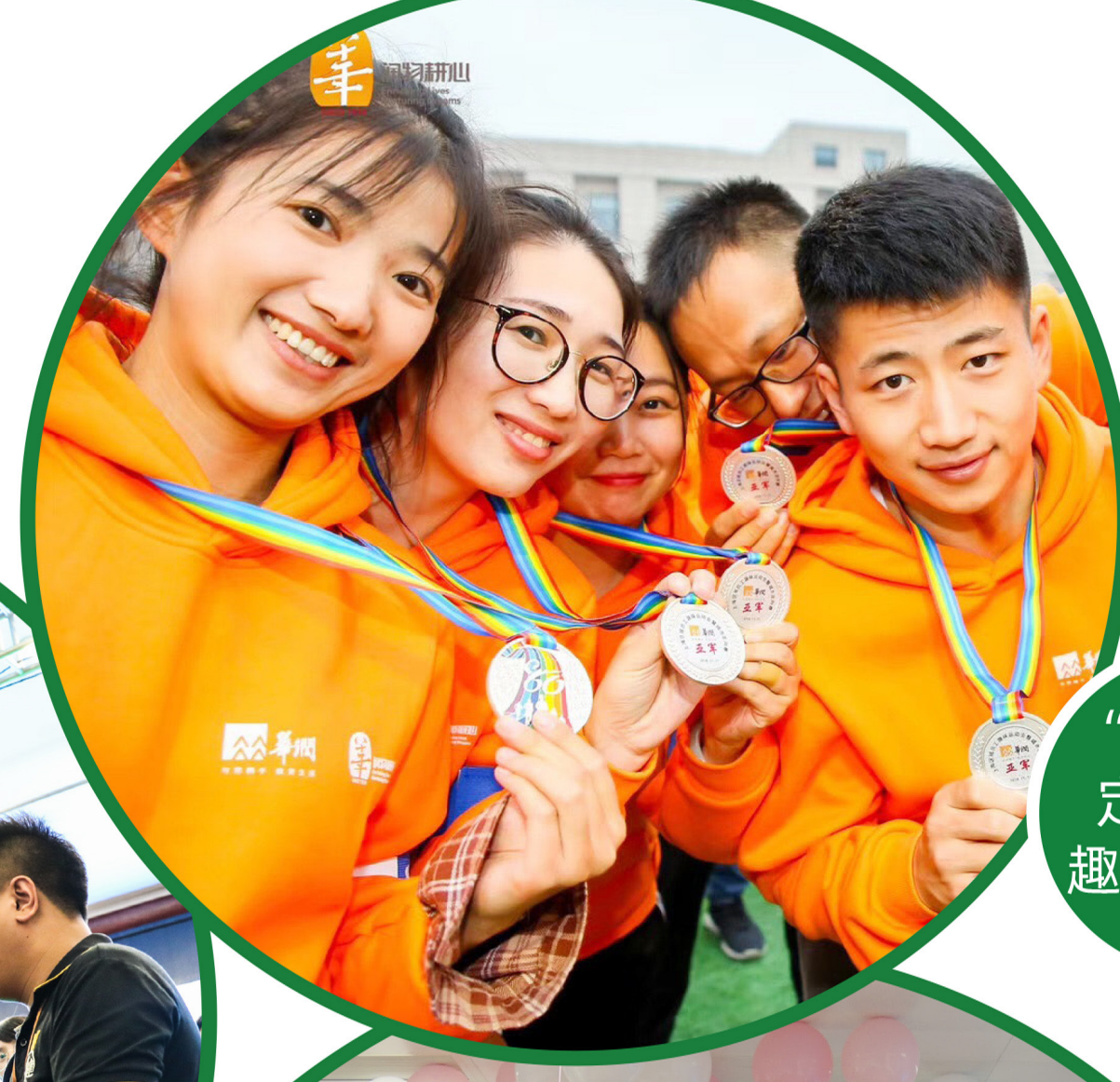
"华润80 定向未来" 趣味运动会