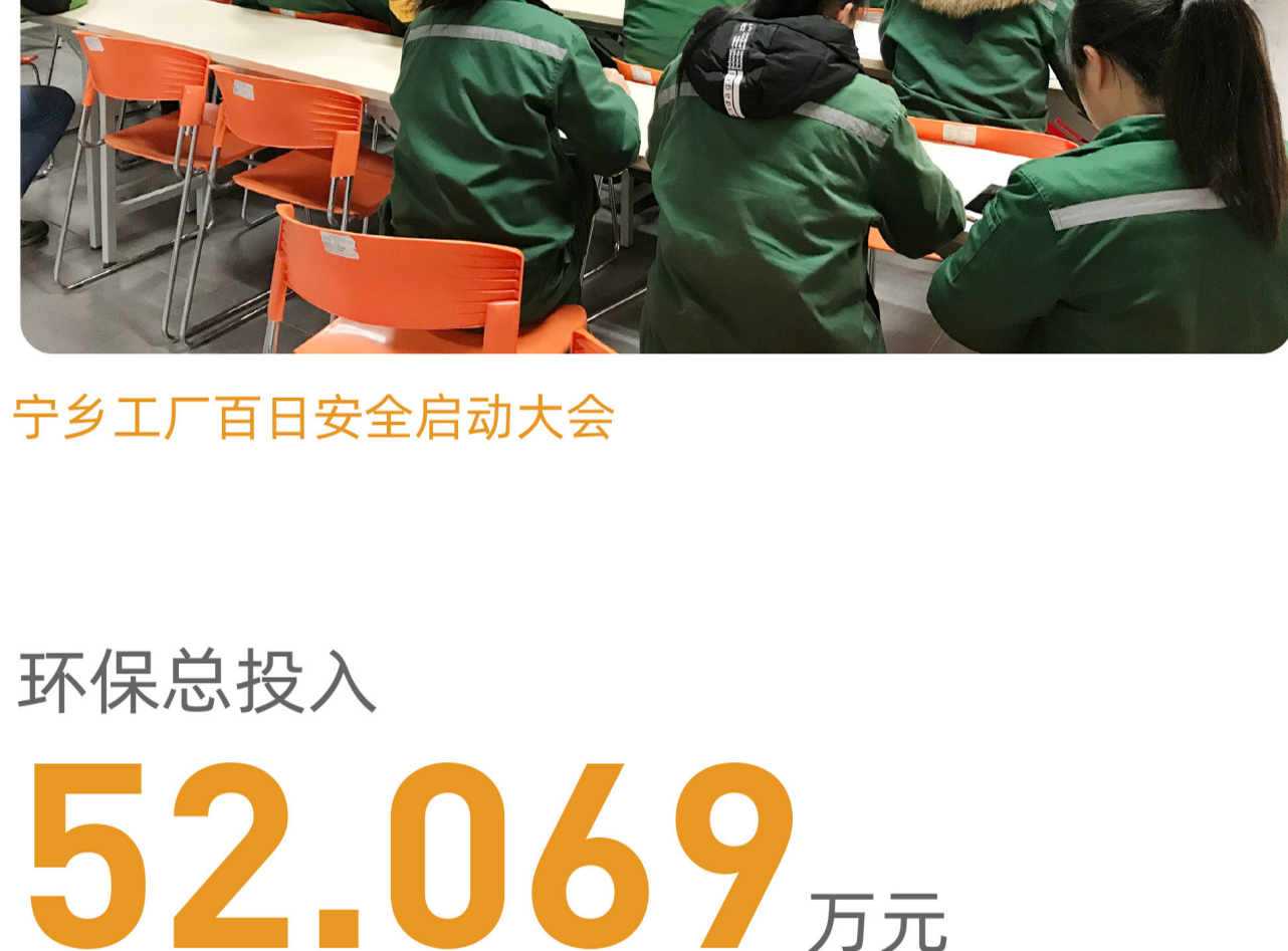
宁乡工厂百日安全启动大会