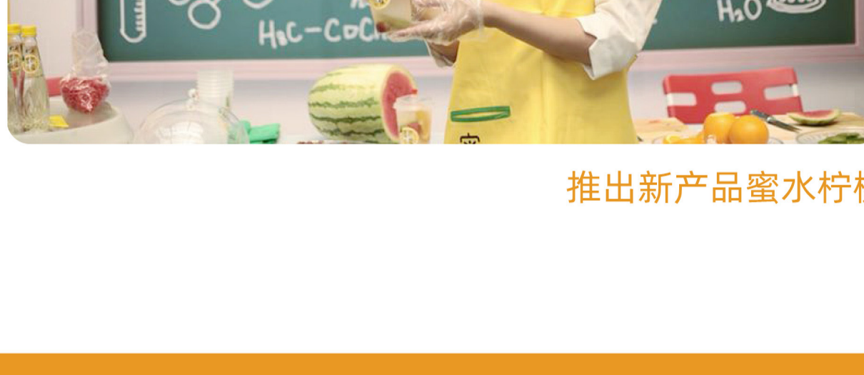
推出新产品蜜水柠檬